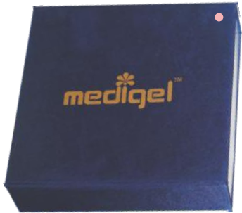
Closed Box with Brand Name

Irradiation Sticker (Red Color indicates Irradiated Item)